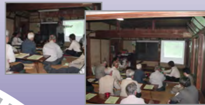
●地域住民と協働による まちづくり方策等の検討 (神奈川県秦野市今泉地区)

都市整備部門では、土地区画整理事業による都市基盤整備にかかわる計画から設計・施工管理までトータル的な支援のほか、近年では、地域住民と行政等の協働によるまちづくり(地域の課題抽出・まちづくり方策検討・実施に際しての住民と行政の役割分担等)に対する支援にも積極的に取り組んでいます。