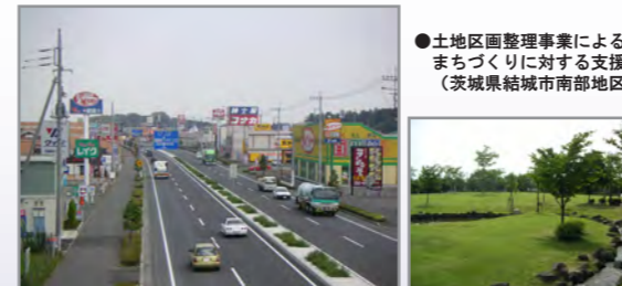
●土地区画整理事業による まちづくりに対する支援 (茨城県結城市南部地区)

都市整備部門では、土地区画整理事業による都市基盤整備にかかわる計画から設計・施工管理までトータル的な支援のほか、近年では、地域住民と行政等の協働によるまちづくり(地域の課題抽出・まちづくり方策検討・実施に際しての住民と行政の役割分担等)に対する支援にも積極的に取り組んでいます。