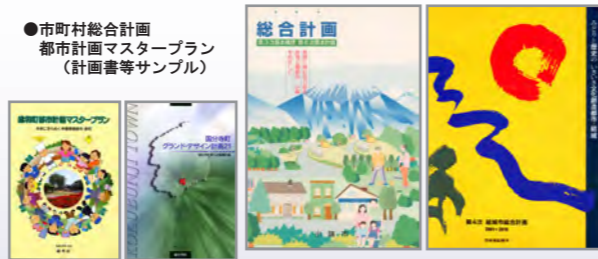
●市町村総合計画 都市計画マスタープラン (計画書等サンプル)

都市及び地方計画部門では、「21世紀の新たな価値を創造し豊かな地域社会の実現」を目指し、地域社会を取り巻く状況を的確に把握しながら、地域の将来像やその実現に向けての都市基本政策の検討と将来整備構想の立案、市街地整備計画や地区計画、あるいは都市計画等の計画を総合的に立案しています。