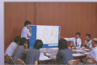
●ワークショップによる議論・検討

都市及び地方計画部門では、「21世紀の新たな価値を創造し豊かな地域社会の実現」を目指し、地域社会を取り巻く状況を的確に把握しながら、地域の将来像やその実現に向けての都市基本政策の検討と将来整備構想の立案、市街地整備計画や地区計画、あるいは都市計画等の計画を総合的に立案しています。