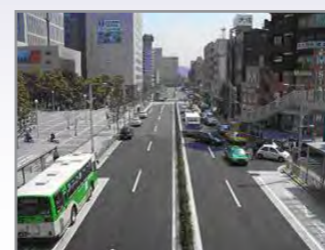
●特別区道243号線道路設計 (港区品川駅前)

当部門では、人と自然の共存及びユニバーサルデザイン等に配慮した計画及び設計をご提案し、人や自然に優しい快適な生活環境づくりを目指しています。