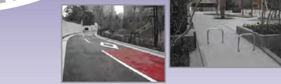
●土地区画整理事業造成・道路設計 (港区赤坂一丁目地区)

土木設計部門では、道路、公園・緑地、上・下水道、宅地造成等の概略・予備・詳細設計などの社会基盤・公共公益施設的设计業務等に携わっています。