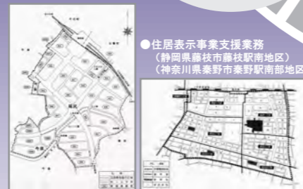
●住居表示事業支援業務 (静岡県藤枝市藤枝駅南地区) (神奈川県秦野市秦野駅南地区)

測量・補償部門では、市街地開発事業に係る地上測量をはじめとする各種地形測量のほか、公共事業に伴う物件調査・積算業務等に携わっています。当部門では、近年、地理情報システム(GIS)を活用した各種調査やデジタルマッピング等へ積極的に取り組んでいます。